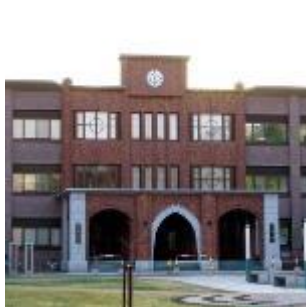
帯広畜産大学見学