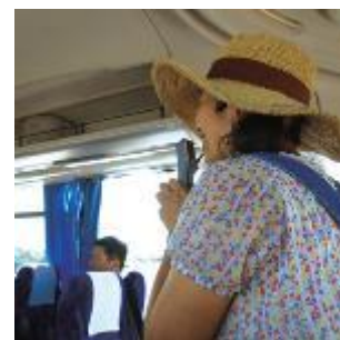
畑ガイドバス添乗