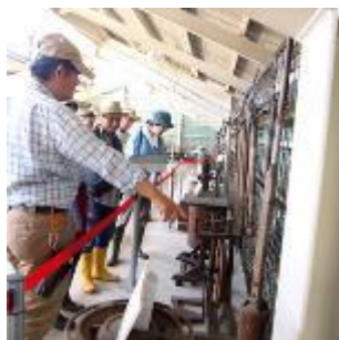
農業関連企業 工場見学訪問